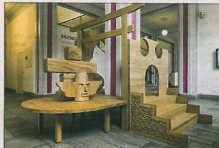
IKKE VELLYKKET: Tanken bak foajemøblet er bedre enn utførelsen.

Utstillingen inneholder arbeider av 16 kunstnere, deriblant to norske, og er delt mellom museets første og andre etasje. I første etasje vises flere verk av høy kvalitet, arbeider som belyser aktuelle problematikker rundt det å befinne seg på usikker grunn og det å leve som papirløse flyktning. Gjennom utstillingen etter spør Trondheim Kunstmuseum felles symboler og bilder som kan forene, og som ikke går på en bestemt religion, etnisitet eller nasjonalitet. Et «svar» gir den